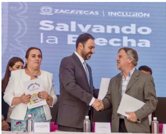
Foto de la izquierda: María de Lourdes Rodarte Díaz, que dirige el Instituto que atiende a personas con discapacidad en Zacatecas; el gobernador Alejandro Tello; y Pete Meslin de AEI.

de transporte de diez estados para discutir su responsabilidad conjunta para atender una brecha en el transporte que provoca que millones de niños con discapacidad en países menos ricos nunca asistan a la escuela. La crisis del transporte también contribuye al aumento de la brecha entre las tasas de alfabetización y las tasas de finalización de la escuela para niños con y sin discapacidad (ver el artículo en la página 6).