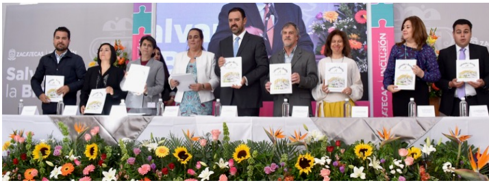
El gobernador Tello (centro) y otras personalidades clave en la presentación de la guía española en Zacatecas